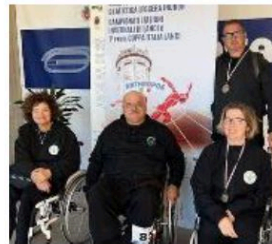
Gli atleti della Santo Stefano